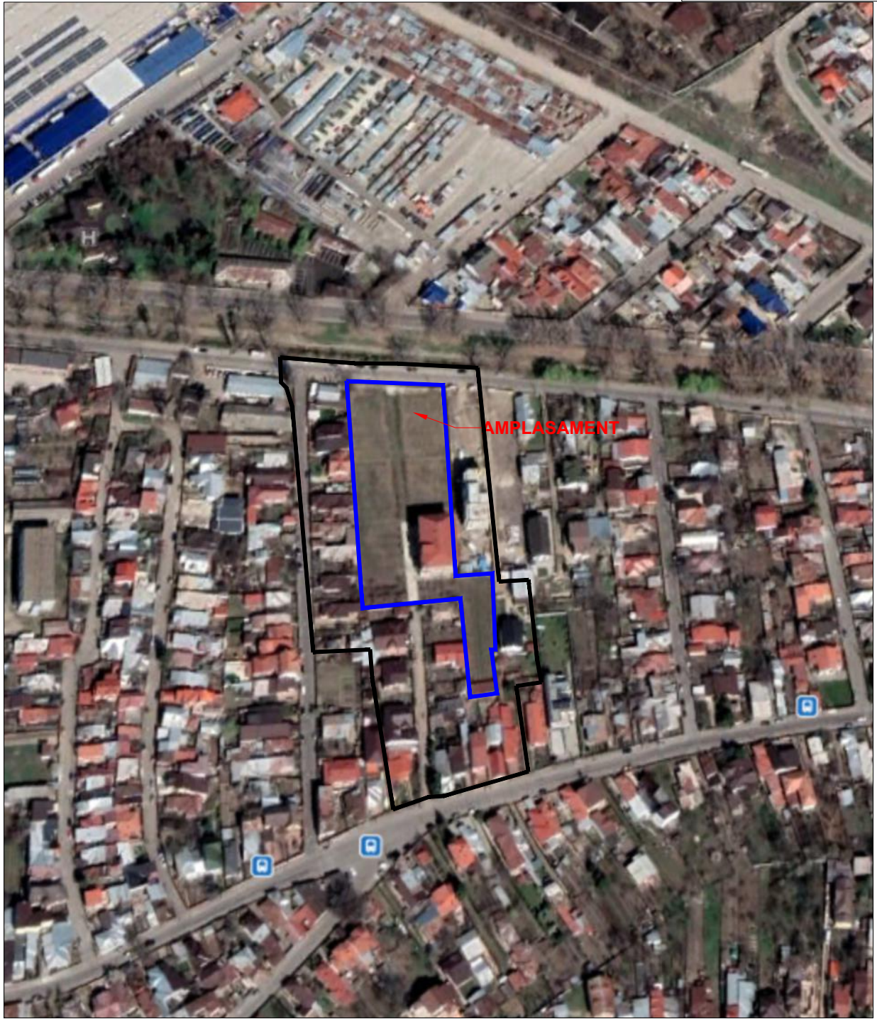
PLAN INCADRARE IN STATELIT sc 1:5000